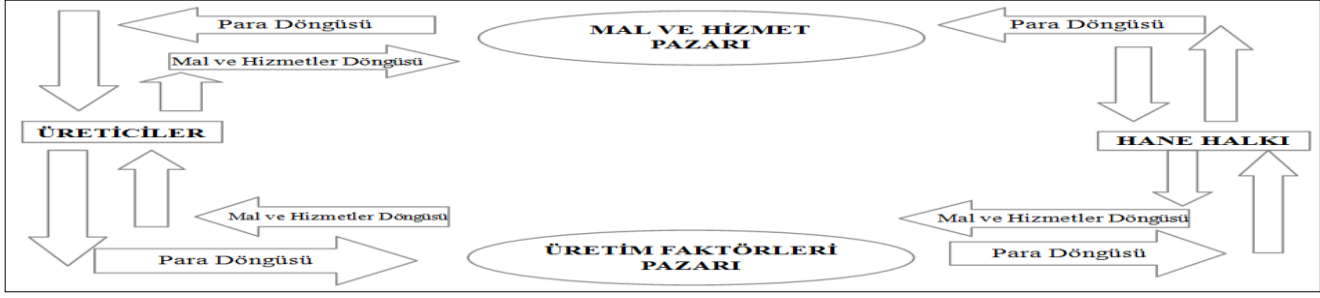
Şekil 2-1: Tabii İktisat Döngüsü

sunan biri olarak “ Mukaddime ” isimli eseri ile tarihi ve sosyal olaylara yön veren etkenleri inceleyerek siyasi, iktisadi ve mali konularda fikirler ileri sürmüştür. Devletin asıl görevi insanlar arasında sulh ve ahengi sağlamalı, ekonomik ve ticari faaliyetlere girmesi ekonomik dengeyi bozar ve serbest rekabetin gelişmesini önler diyerek devletin görev kapsam ve alanını belirlemiştir.